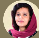
أمراخ تاج الختم صحفية سودانية مستقلة