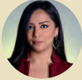
روعة أوجيه مذيعة ومقدمة برامج بشبكة الجزيرة