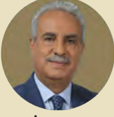
محمد كريشان مذيع ومقدم برامج بقناة الجزيرة الإخبارية